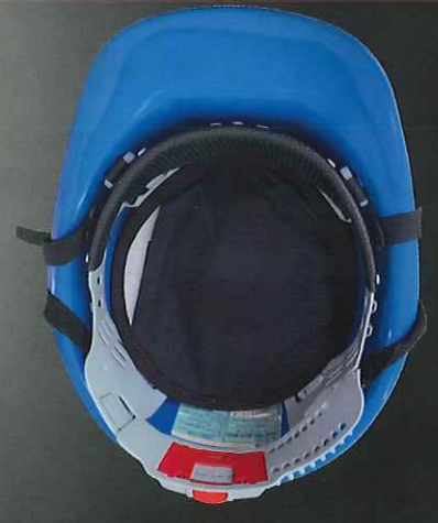
シリカクリン® ヘルメット用 遮熱インナーパッド クールタイプ