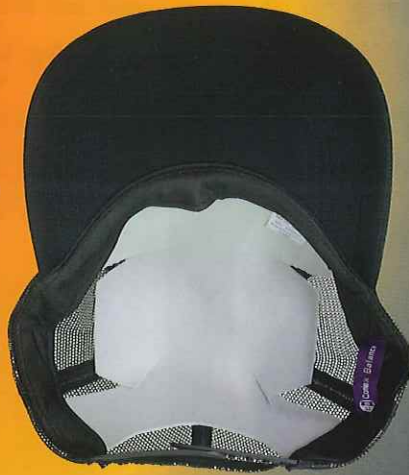
シリカクリン® クールタイプ キャップ用遮熱シート