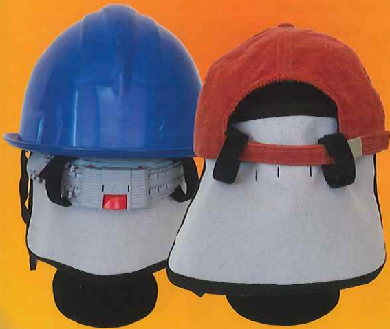
シリカクリン® クールポケット付 遮熱ネックカバー クールタイプ