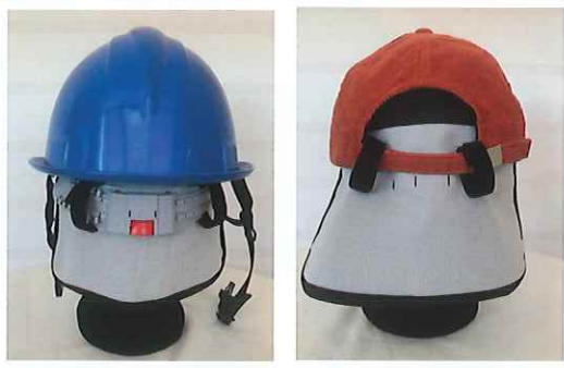
ヘルメットやキャップのヘッドバンドに面ファスナーで簡単に取付けできます。

気化熱量をアップし、肌へのドライ感アップ!! 酷暑の太陽光を大幅カット!! ヘルメット用クール+ポケット付で消臭効果も!!