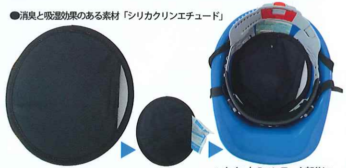
「ヒエールポケット」に保冷剤を入れることで 冷たさが持続。濡らすことでさらに効果的