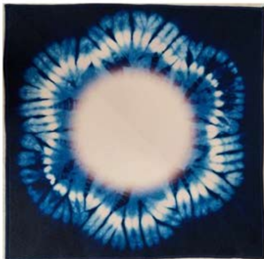
■商品名:スマートラップ(富士山)